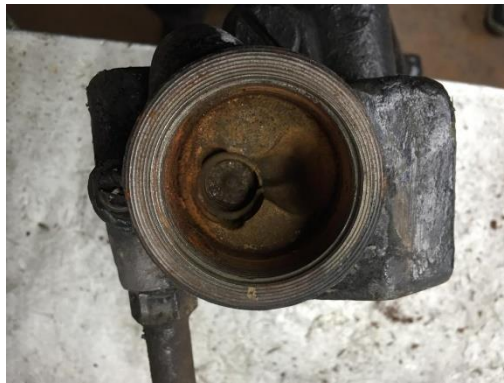
Hebelarm- Stossdämpfer vorne revidiert