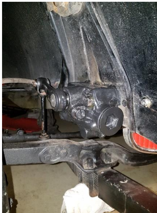
Hebelarm- Stossdämpfer hinten Jan 2019 revidiert